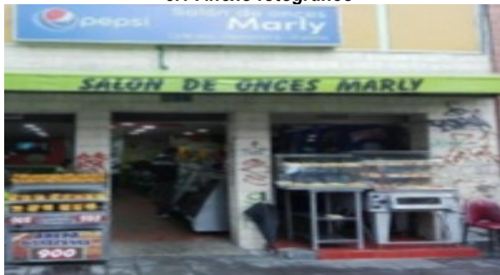
Fachada del establecimiento con publicidad exterior visual